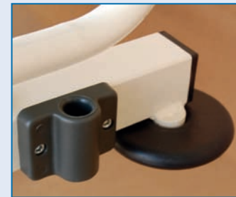
IV-Halter & Wandabweiser