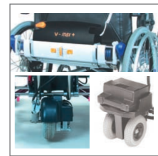
Elektrische Schiebe- & Bremshilfe für alle XXL Rollstühle bis 340kg

Diverse Anbaumodelle ja nach Anforderungen und Kompartibilität bis zu 340kg Belastbarkeit.