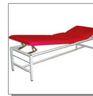
Liege adicare XXL400, 3-teilig.