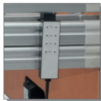
Trendelenburgoption (bei Bettneubestellung) inklusive Handbedienung Reha-Home Art-Nr. 080183

Selbstverständlich können die Trendelenburg- oder auch alle Funktionen mit dem Personalsperrschlüssel gesperrt werden.