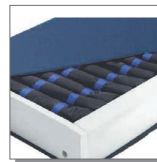
Aktive Druckentlastungssysteme zur Dekubitusprophylaxe

Aktive Druckentlastungssysteme mit moderner Technologie und intelligenter Steuerung. Dynamische und statische Modi möglich. Auch mit Randverstärkungen zum optimiertem Ein- und Ausstieg. Ebenso mit Oberflächenabdeckungen der Luftzellen fürs verbesserte Körpergefühl. Leise und langlebige Systeme erhältlich. Sehr einfache und sichere Bedienung und lange Akkulaufzeiten bei Netzausfall. Unterlagen bitte anfordern.