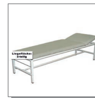
Liege adicare XXL400, 2-teilig.