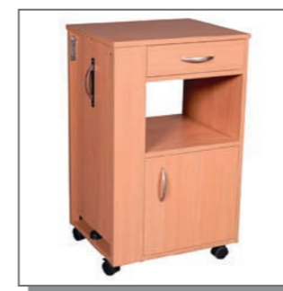
Nachttisch Bergen für Bett Reha-Home XXL-380 Art-Nr. 080190

Wählen Sie zwischen der einfachen und der extra-verstärkten Version. Der Überbettisch des Nachttisches ist bei der verstärkten Version erheblich stabiler, um ein mögliches Auflehnen oder Aufstützen abzufedern. Der Nachttisch ist in vielen verschiedenen Holzönen erhältlich.