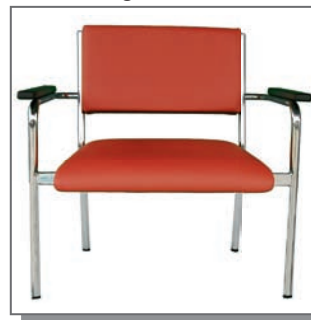
Stuhl Conti XLL-400 <400kg, Sitz (BxTxH) 61x52x44cm, Armlehnenabstand 71cm, Bezug, Höhe, Gestellfarbe nach Wahl

Garantie: fünf Jahre auf Stabilität und auf Polsterung, nicht aber auf Verschleißteile wie Armlehnen, Fußstopfen, Bezug