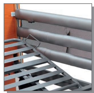
Seitengitterpolster 200cm für Bett Reha-Home XXL-380 Art-Nr. 080177

Erhältlich in zwei Längen (für die zwei unterschiedlichen Bettlängen): 200 oder 220cm