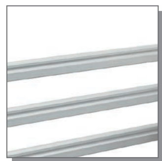
Seitengitterersatz 200cm für adicare REHA-HOME Art-Nr. 080186

Die Seitengitter sind immer aus hygienischem Aluminium, pflegeleicht und komfortabel in der Handhabung.