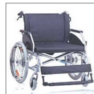
Rollstuhl HD-BR, bis 227kg, Sitzbreite 60cm Art-Nr. 070500 Rollstuhl HD-BR, bis 227kg, Sitzbreite 65cm Art-Nr. 070501 Rollstuhl HD-BR, bis 300kg, Sitzbreite 70cm Art-Nr. 070502