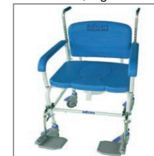
Dusch- u Toilettenrollstuhl XL250, <250kg, Sitz 66x56,5x44 (BxHxT)

abschwenkbare Armlehnen und verstellbarer Schiebegriff Hohe Verarbeitungsqualität und maximale Funktionalität: hochwertige Epoxy-Einbrennlackierung. Große, gepolsterte Sitzfläche mit abdeckbarem und reversiblen Hygieneausschnitt aus strapazierfähigem, hautfreundlichen Kunststoff. Dieser ist schmutzunempfindlich und leicht zu reinigen. Einfacher Ein- und Ausstieg durch abschwenkbare Armlehnen und schwenkbare Fußstützen. Räder mit Feststellbremse und Richtungsfeststeller. Die Schiebegriffe für Helfer sind höhenverstellbar. Mit Eimer. Technische Daten auf einen Blick: Belastbarkeit: 250kg Sitzfläche: 56x44x56,5cm (BxTxH) Armlehnenabstand: 56cm Außenmaße: 68x97cm (BxH) Überfahrhöhe für Standard und Clos-O-Mat Toiletten Gewicht: 17,5kg